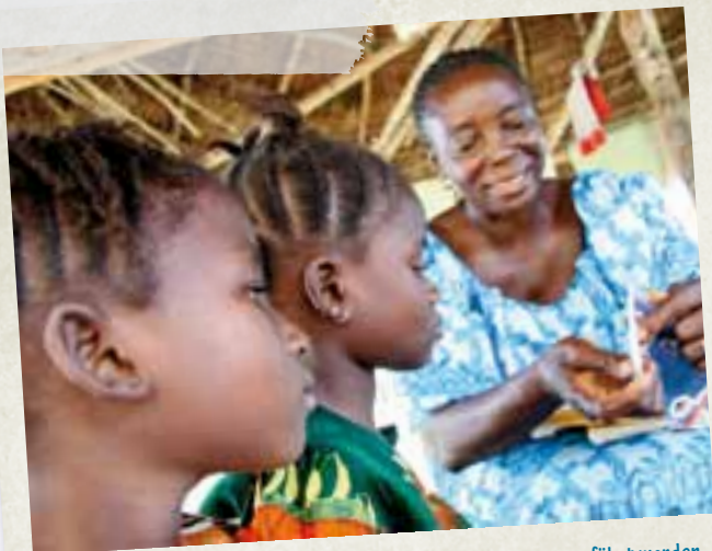
Schon Kinder sollen behutsam an das Thema HIV und AIDS herangeführt werden, damit sie früh genug über Ansteckungswege und Vorbeugung aufgeklärt sind.