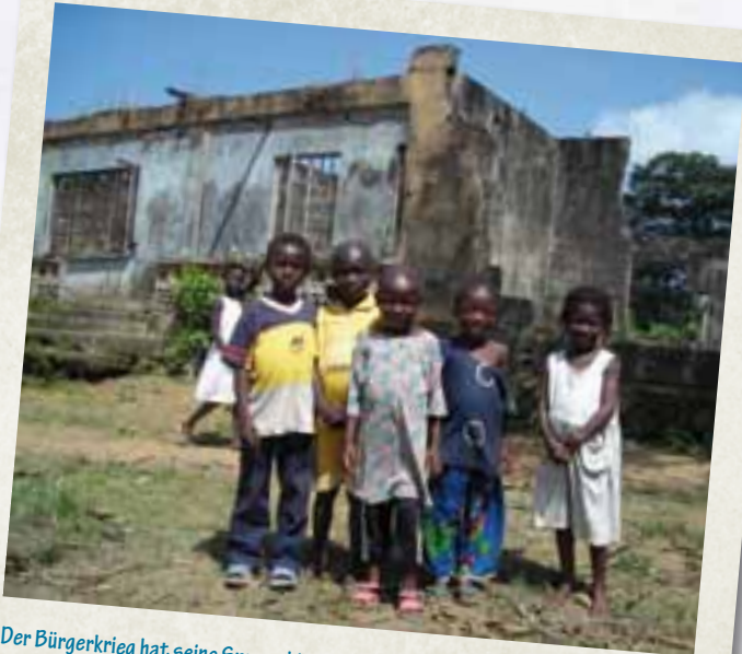
Der Bürgerkrieg hat seine Spuren hinterlassen. Doch die junge Generation soll möglichst gesund und unbeschwert aufwachsen können.

Gemeinsam mit den Bewohnern des Projektgebiets wird Informationsmaterial erstellt und verteilt. Dabei ist zum einen wichtig, dass Broschüren und andere Medien in der lokalen Sprache verfasst sind, aber auch, dass sie für Analphabeten verständlich sind, weil längst nicht jeder lesen und schreiben kann.